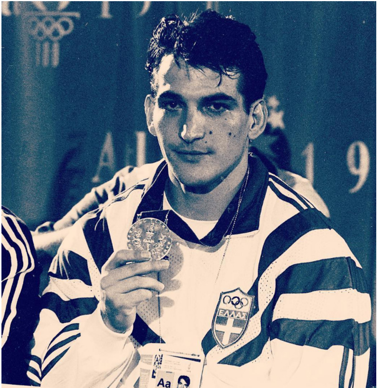
Ολυμπιακοί αγώνες του 1996, Ατλάντα