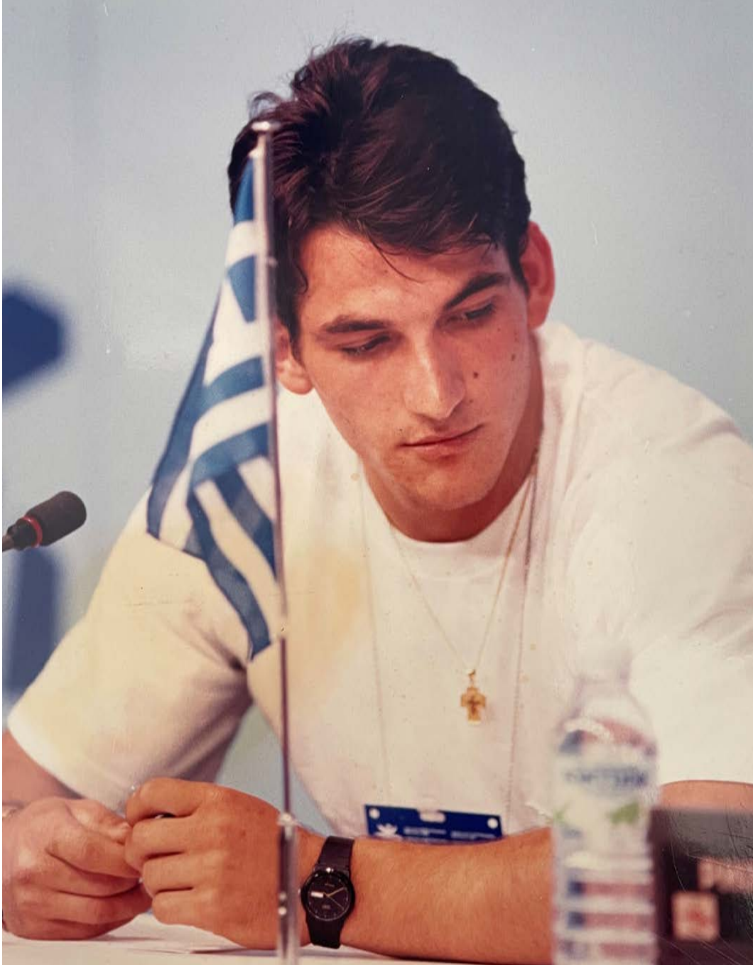
Ολυμπιακοί αγώνες του 1992, Βαρκελώνη