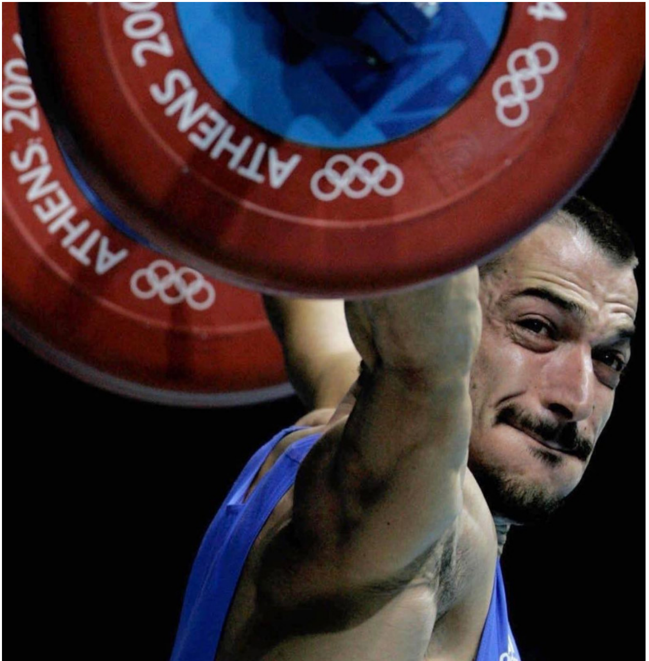
Ολυμπιακοί αγώνες του 2004, Αθήνα