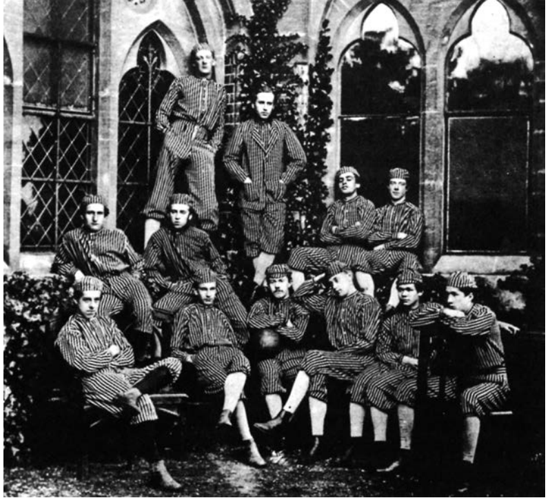
Εικ. 1.2. Σχολείο Harrow XI (1867), μια εφηβική σχολική ομάδα που αναδεικνύει την εμφάνιση και τη μπάλα που χρησιμοποιούνταν εκείνο τον καιρό.

Για ποιο λόγο οι μαθητές στο Eton να θέλουν ένα τέτοιο είδος αγώνα; Μια αβέβαιη πιθανότητα είναι ότι οι μαθητές του Eton έπαιζαν ολόκληρο την αγώνα με τον τρόπο που προφανώς συνέβαινε και στα υπόλοιπα σχολεία. Πάντως είναι απίθανο να ήταν είχαν τέτοιο «πολιτισμικό εθισμό». Το σχολείο τους θεωρούνταν ότι πρωτοστατούσε σε όλους τους τομείς. Εξάλλου ήταν το δεύτερο σε παλαιότητα, έχοντας μόνο το Winchester να περηφανεύεται για μεγαλύτερη περίοδο επικράτησης. Έχοντας ιδρυθεί από τον Henry τον VI κατά το 1440, το Eton μπορούσε ακόμα να υπερηφανεύεται για την βασιλική του καταγωγή. Επιπλέον λόγω της γειτονίας του με το Windsor, εξακολουθούσε να έχει σχέσεις με την βασιλική αυλή. Κάποιος θα μπορούσε εύκολα να φανταστεί πως θα είχαν αντιδράσει οι μαθητές του Eton στην ανά-