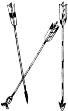
Τρεις τύποι βελών

Δεν έχει δοθεί καμία ξεκάθαρη και ικανοποιητική απάντηση σχετικά με το γιατί οι άνθρωποι πολεμούν. Οι άνθρωποι είναι μαχητικά πλάσματα και προσπαθούν να καταστρέψουν ο ένας τον άλλον από την προϊστορική ακόμα εποχή. Είτε η επιθυμία για μάχη προέρχεται από την ανθρώπινη φύση, είτε είναι τέκνο του πολιτισμού, είναι ξεκάθαρο πάντως ότι η μάχη είναι ένα μοντέλο