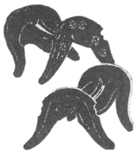
Ξύλινες βάσεις για σέλες

κούρα (1185-1336): στο Χόγκεν Μονογκατάρι (Ιστορία του Πολέμου Χόγκεν), το Χέιτζι Μονογκατάρι (Ιστορία του Πολέμου Χέιτζι), το Χέικε Μονογκατάρι (Ιστορία του Οίκου των Τάιρα ), το Γκεμπέι Σεϊσούικι (Μαρτυρία της Ανόδου και της Πτώσης των Μιναμότο και των Τάιρα ) και το Αζούμα Καγκάμι (Καθρέφτης της Ανατολικής Χώρας).