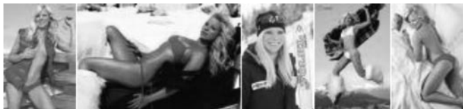
Εικόνα 18. Η Αμερικανίδα σκιέρ Lacy Schnoor 48