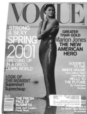
Εικόνα 14. Η Marion Jones σε εξώφυλλο του αμερικανικού περιοδικού Vogue

Η μοντελοποίηση της αθλήτριας σαφώς αποτελεί κάτι καινούργιο. Στο παρελθόν σπάνια εμφανίζονταν αθλήτριες σε εξώφυλλα περιοδικών ευρείας κυκλοφορίας και ακόμα πιο σπάνια σε αθλητικά περιοδικά ή στον αθλητικό Τύπο (Καμπερίδου, 2005). Παραδοσιακά, ο γυναικείος αθλητισμός στις Η.Π.Α. ήταν άγνωστος στα μέσα μαζικής ενημέρωσης – έντυπο, ραδιόφωνο και τηλεόραση. Για παράδειγμα, τα πρώτα 25 χρόνια του γνωστού αμερικανικού περιοδικού Sports Illustrated παρατηρείται ότι οι αθλήτριες εμφανίζονταν σε μόνο 4,4% από τα 1.250 εξώφυλλα (Guttman, 1991: 215). Τα τελευταία 60 χρόνια –μέχρι το 2010– μόνο το 4% των εξωφύλλων του Sports Illustrated εμφάνισαν γυναίκες. 45 Ωστόσο, σήμερα προβάλλονται