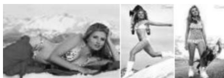
Εικόνα 17. Η Αμερικανίδα snowboarder Clair Bidez 47