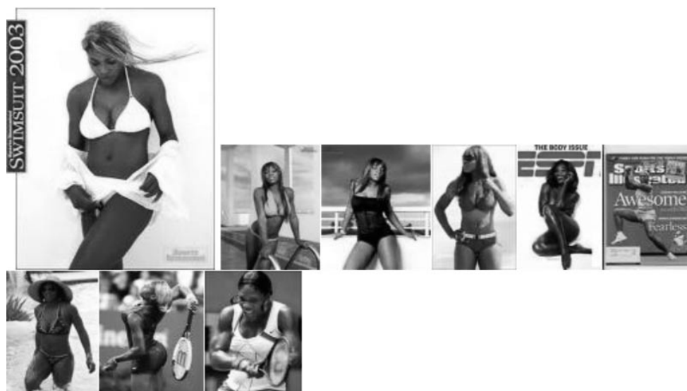
Εικόνα 15. Η Serena Williams στο Sports Illustrated . 46 Γυναίκες ολυμπιονίκες στο τεύχος Sports Illustrated Swimsuit 2010