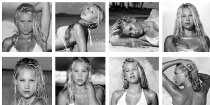
Εικόνα 21. Προκάτοχος αυτών των καλλονών ολυμπιονικών η Anna Kournikova (στο Sports Illustrated 2008) 52