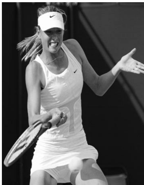
Εικόνα 22. Η Anna Kournikova με το αθλητικό συνολάκι της

Ο Gary Hoenig, εκδότης του ESPN The Magazine , παρατηρεί ότι αυξάνεται η κάλυψη της γυναίκας αθλήτριας στα Μ.Μ.Ε. και, όσο εκείνη γίνεται πιο όμορφη, η προβολή της θα αυξηθεί περισσότερο, επισημαίνοντας ότι σήμερα οι αθλήτριες αποκαλούνται σέξι, καυτές κ.ά.: "Today, you hear words like 'sexy', 'hot', and even 'fuckable'". Επισημαίνει επίσης ότι οι ειδικοί υποστηρίζουν ότι η μαζική έλξη για την αθλήτρια Anna Kournikova έχει επηρεάσει τον γυναικείο αθλητισμό. «Η Anna άλλαξε το τρόπο με τον οποίο οι άνθρωποι βλέπουν τις αθλήτριες. Η Anna δεν επικεντρώνεται μόνο στο να είναι σταρ στο άθλημά της [τένις]. Θέλει να είναι και σταρ σε επίσημες εκδηλώσεις, στον κουτσομπολίστικο Τύπο και σε ημερολόγιο που εμφανίζεται με μαγιό. Το ότι δεν κέρδισε ποτέ ατομικό τουρνουά και ότι μετά βίας έφτασε στους δέκα κορυφαίους κατά την αθλητική καριέρα της δεν αλλάζει το γεγονός ότι φαίνεται υπέροχα καυτή με το αθλητικό συνολάκι της» (Cherwa, 2003: 258).